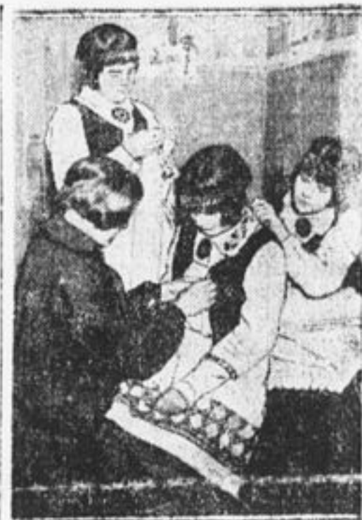
Латышский детдом готовится к выступлению на всесоюзном радиослете.