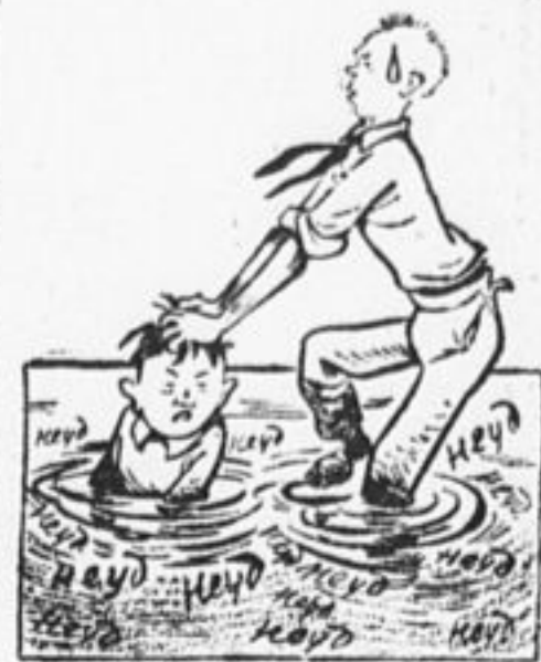
Ребята, взгляните на него: Бедняга в скорости раскисает. Он «нагрузился» до того, что сам в болото погружается.