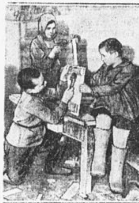
В детской комнате.