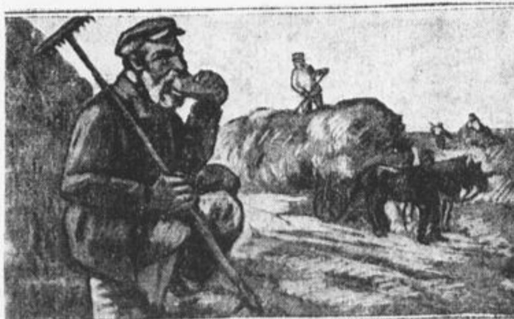
Из альбома художника Альтмана. Зарисовки сделаны в еврейских колониях Крыма.