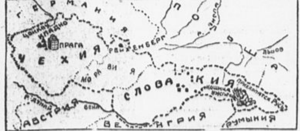
Найдите на карте Чехо-Словакии города, от которых выступали делегаты съезда.

У нас очень много неграмотных коммунистов. По вечерам они собираются и один десятилетний пионер читает им вслух газеты.